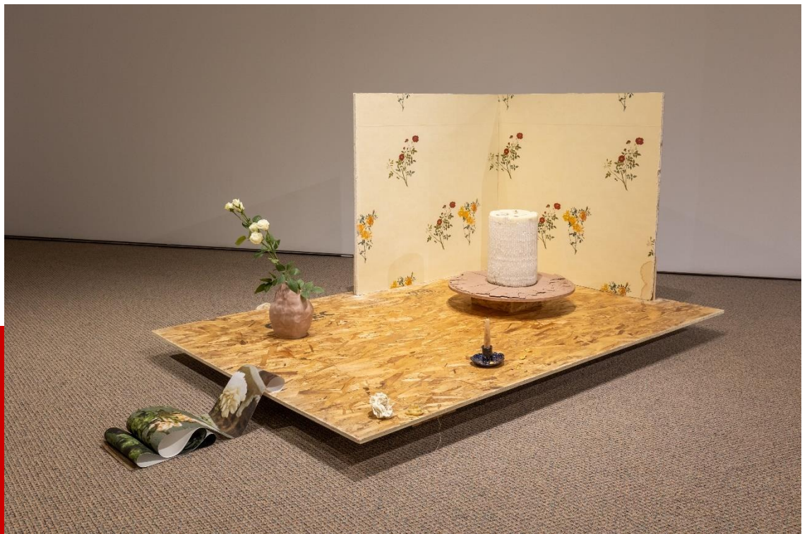
Détail de l'exposition Fragments de roses , d'Eve Tagny