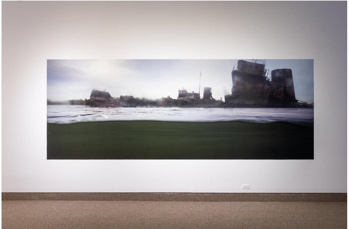
Détail; de l'exposition Histoire d'eau d'Isabelle Hayeur. Œuvre : Death in absentia , 2011