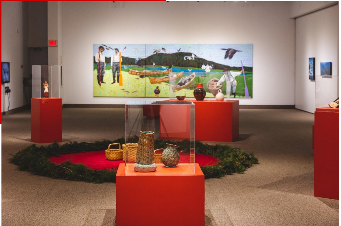
En haut: Vernissage de l'exposition KMAWQEPIYAPON (Nous sommes assis.e.s dans le même cercle), 10 juin 2022 En bas : Vue de l'exposition KMAWQEPIYAPON (Nous sommes assis.e.s dans le même cercle).